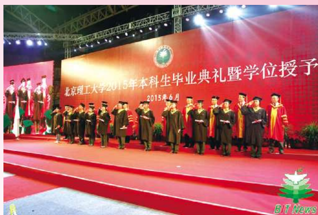
典礼上那些别样的风景,是北理海纳百川的怀抱,是母校见证五湖四海学子成才的最好宣告。