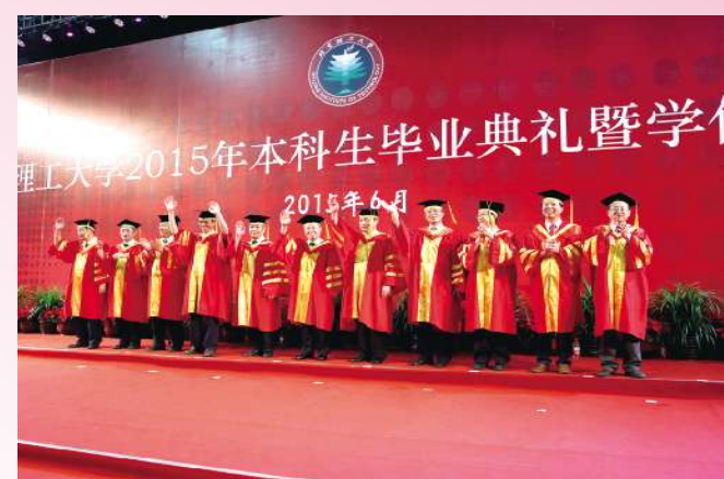
北京理工大学“第一男子天团”:亲爱的同学们,记得常回家看看!

2011年夏天,朝气蓬勃的你们带着稚嫩的笑脸来到这里,整齐的宿舍楼,雄伟的教学楼、实验室,尚未完工的北湖,还有那让人爱恨交加的良乡“中食堂”,带着军训后黝黑的面庞,四年的大学生活就这样在懵懂和未知中正式交锋。经历激情、坎坷、迷惘、奋斗和梦想,四年后的今天,你们收获成熟,收获希望,收获纯真的友情和爱情。你可以留恋,可以不舍,但请展开你雄鹰般的臂膀,继续奋力翱翔。在走出学校的那一刻,铭记“懂得付出、恪守责任”,尽一名北理人应有的责任和使命,勇于担当,维护社会良知,肩负起实现中国梦和中华民族伟大复兴的历史使命!