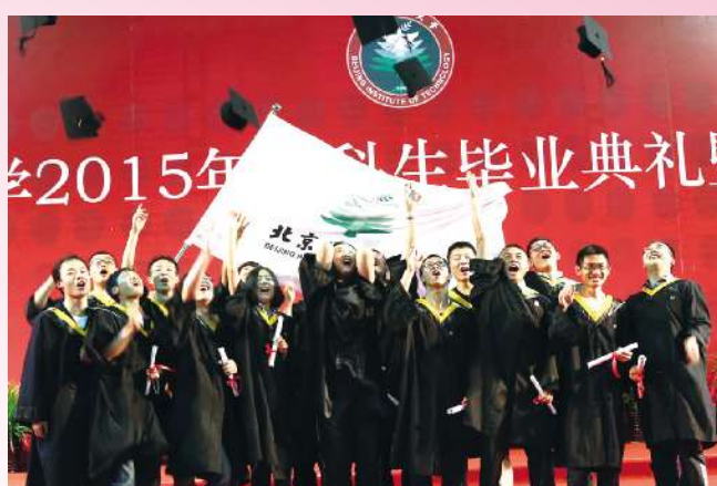
抛起学士帽,我们毕业啦!再见,北理;再见,恩师;再见,同学们;再见,留在我心底的那个你。