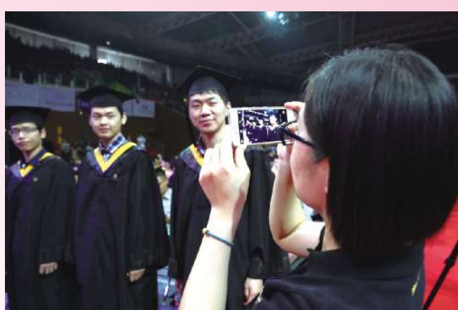
我愿意为你们记录你们最光荣、最难忘的日子,离开不是结束,我在心底默默的祝福。从来都不需要想起,永远也不会忘记。