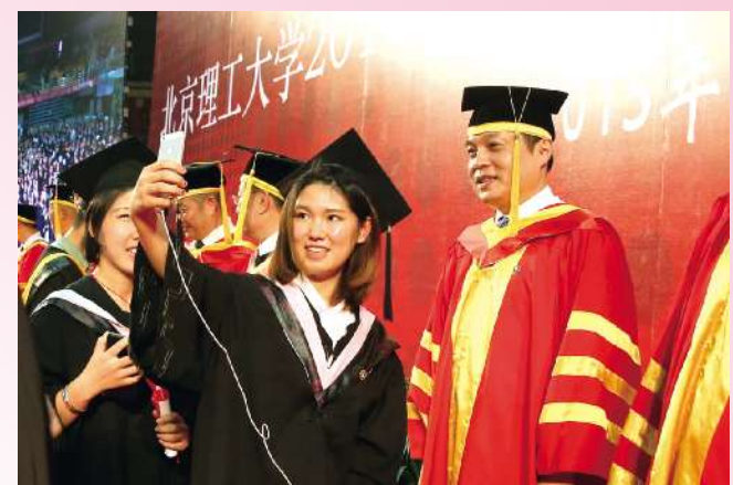
菁校园,青青岁月,感谢母校的培养,感谢恩师的教诲,感谢这自始至终,不离不弃的每一位。