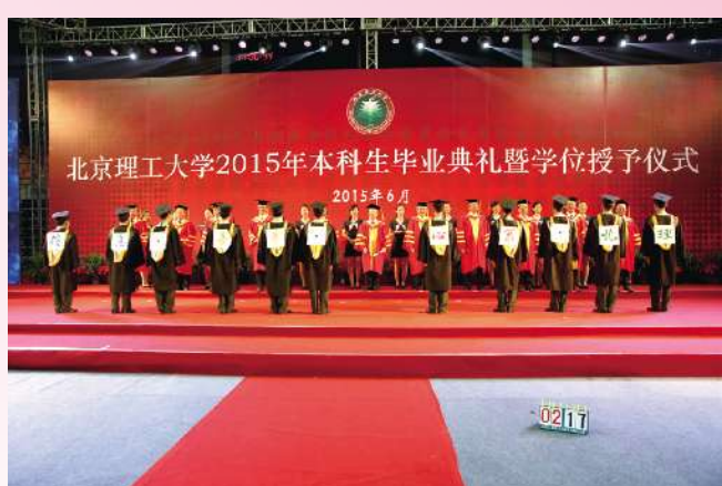
亲爱的北理,我们之所以能够胸襟挺拔、顶天立地,正因为背后有你,一路有你!