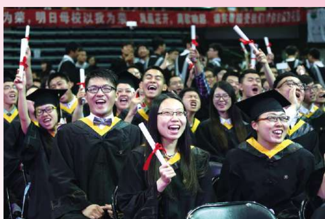
同学,是难过时倾诉的对象;同学,是快乐时分享的好友;同学,永远是在我们需要时最坚实的港湾。北理毕业季,让我们笑着说再见。