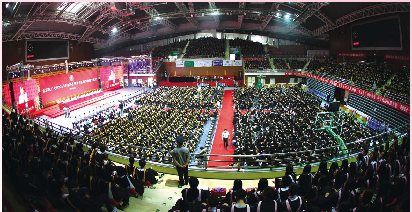
那一天,我们一起参加的毕业典礼,你知道它有多壮观吗?茫茫人海中,快来找找那一刻的你。