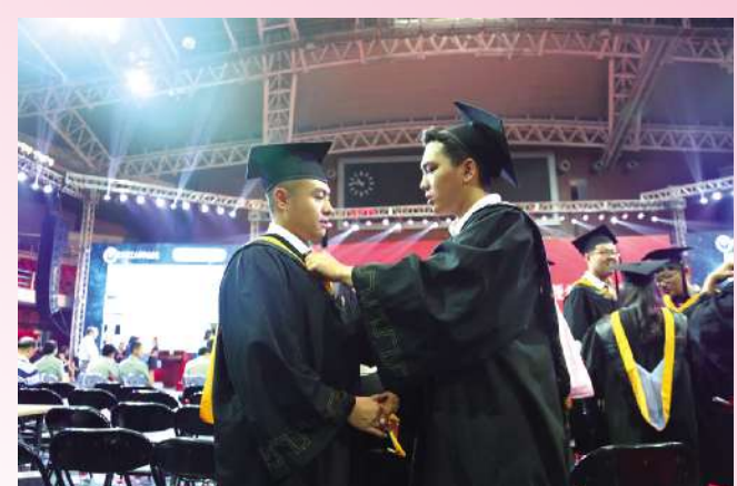
每当思绪回到和大家一起走过的北理岁月,总是仿佛能够触及到那份伴着泪水与欢笑的美好时光。无论咫尺天涯,记得北理是你我共同的印记。兄弟,保重!