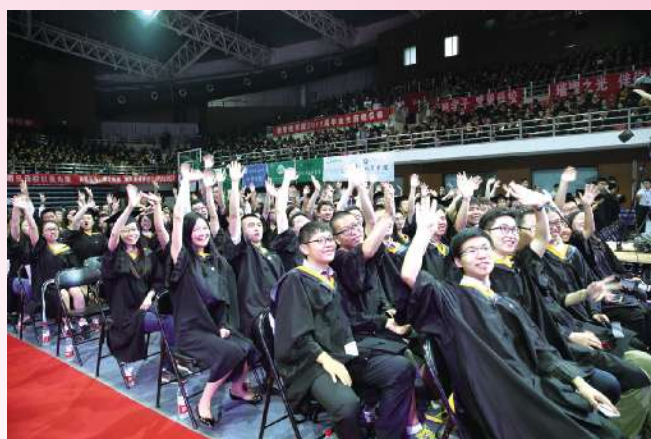
那是在北理的最后一天,结束了往日可以同时看见几百张熟悉笑脸的日子。