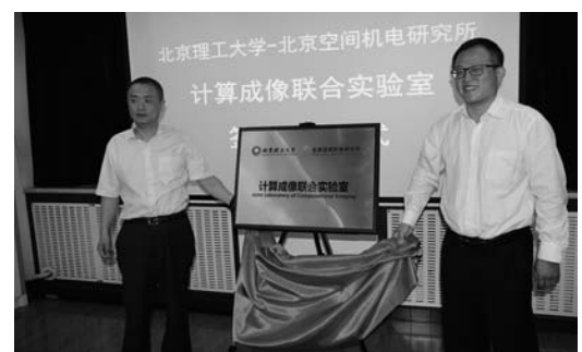
补”的合作方针,“计算成像联合实验室”以成为光学遥感装置方面最核心的国家队和国际领先的研究团队为目标,将研发新型光学遥感装置,全面提升我国新型光学遥感装置的性能,力争五年内建成省部级科技平台。

根据协议内容,“计算成像联合实验室”将以航天遥感、深空探测等领域的重大科学问题为导向,以计算成像为主要合作领域,协同创新,切实提高我国遥感器的成像性能的合作目标;合作内容涵盖理论研究、装备研发、工程应用、应用推广和人才培养等多个方面。本着“顶层设计,协同创新,优势互补”的合作方针,“计算成像联合实验室”以成为光学遥感装置方面最核心的国家队和国际领先的研究团队为目标,将研发新型光学遥感装置,全面提升我国新型光学遥感装置的性能,力争五年内建成省部级科技平台。