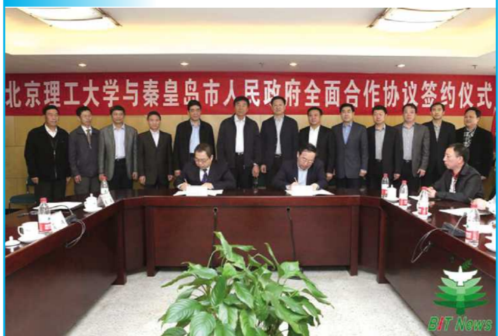
4月13日,我校与秦皇岛市人民政府全面合作协议签约仪式在我校国际教育交流中心举行。根据协议内容,双方将在经济、科技、教育和人才等方面开展多领域合作,并共建产学研合作基地及科学研究、成果转化和高层次人才培养的合作平台。