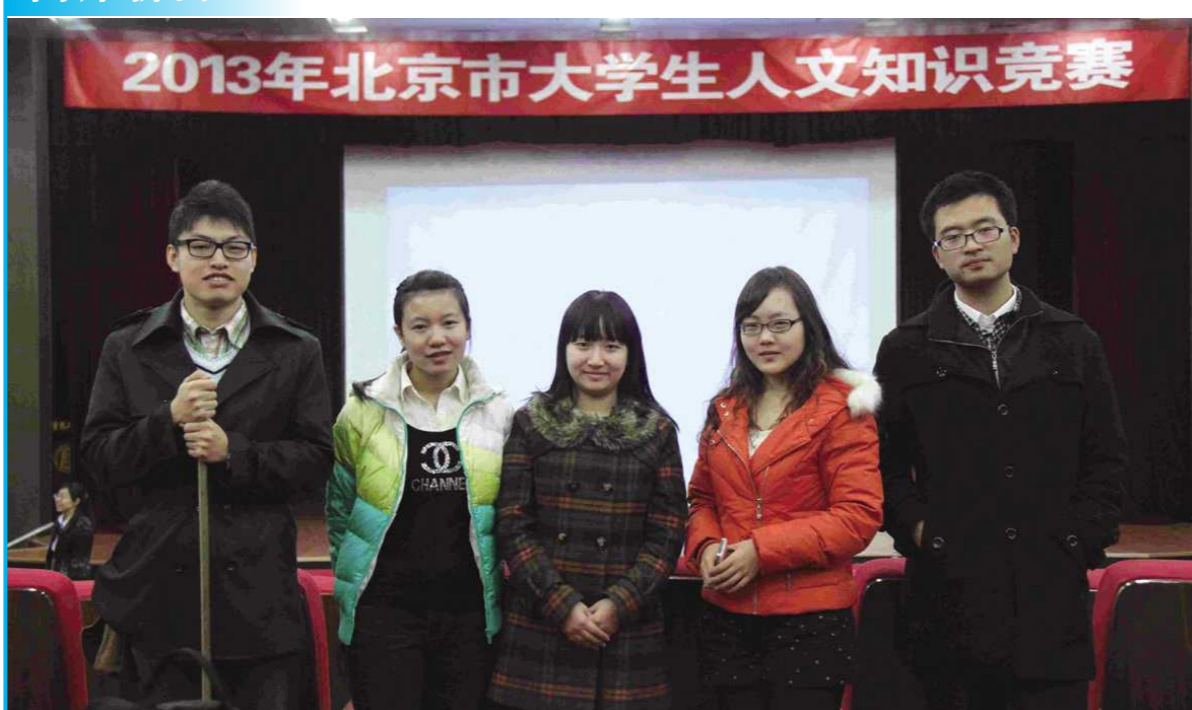
2013 年北京市大学生人文知识竞赛复赛在北京理工大学进行,我校代表在与清华大学、中国政法大学、中国青年政治学院等众高校中的激烈竞争中,获得三等奖的优异成绩。我校同学严谨、踏实、创新的精神给大家留下了深刻的印象,很好的展现了“德以明理,学以精工”的北理工风采。