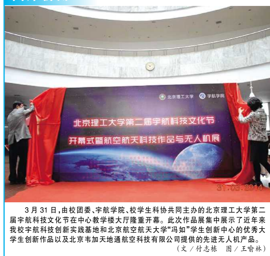
3 月 31 日,由校团委、宇航学院、校学生科协共同主办的北京理工大学第二届宇航科技文化节在中心教学楼大厅隆重开幕。此次作品展集中展示了近年来我校宇航科技创新实践基地和北京航空航天大学“冯如”学生创新中心的优秀大学生创新作品以及北京韦加天地通航空科技有限公司提供的先进无人机产品。