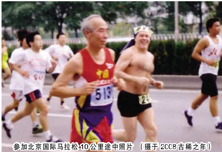
参加北京国际马拉松10公里途中照片 (摄于2008古稀之年)

又到春暖花开时,各学院、学校、北京市高校又要相继举行田径运动会,这使我想起了青少年时代喜爱、实践体育锻炼并养成坚持长跑锻炼习惯,使我一生受益,想把我的长(常)跑情写出来与大学生们共享。