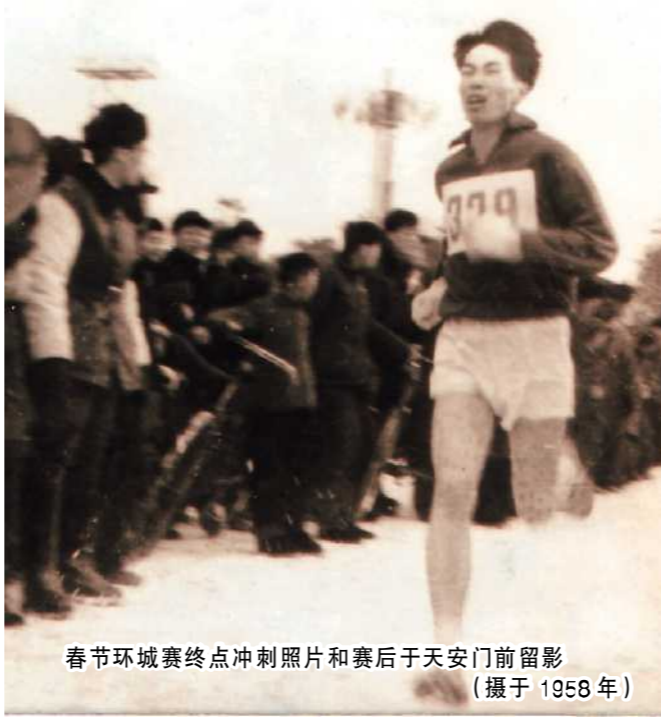
春节环城赛终点冲刺照片和赛后于天安门前留影 (摄于1968年)